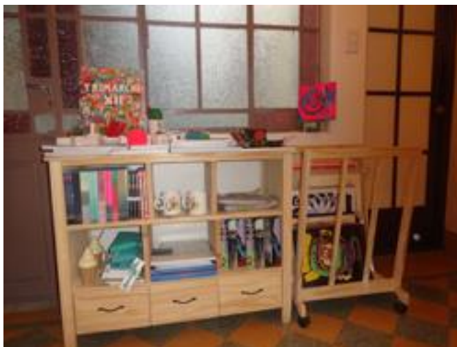
Galería de Arte Trémula: trastienda.