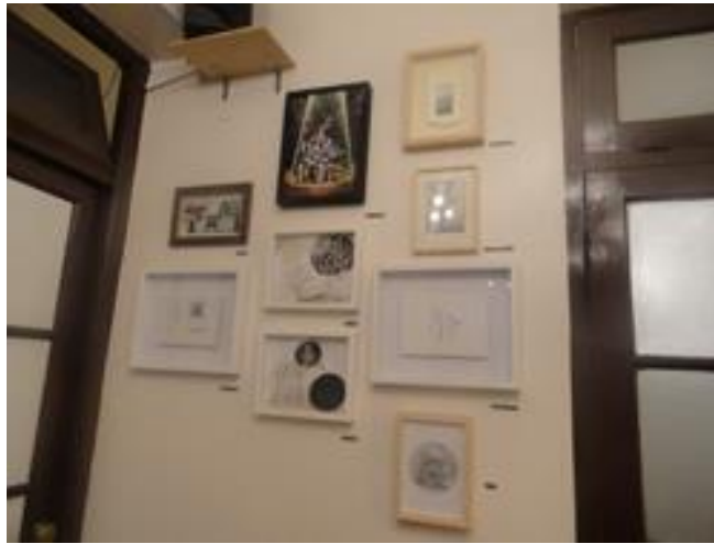
Trastienda ubicada en el vestíbulo. Galería de Arte Trémula.