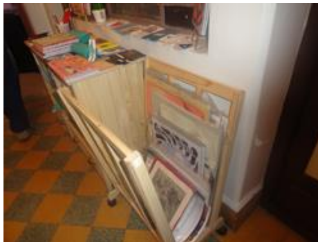
Galería de Arte Trémula: trastienda.