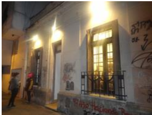
Fachada Galería de Arte Trémula. Calle 8 N° 1287 entre 58 y 59, La Plata.