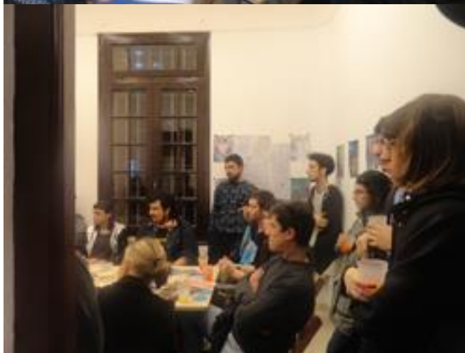
Instancias de capacitación y debate en espacio Trémula.